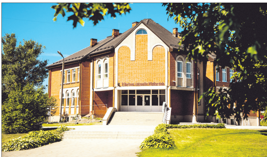
JAUNU VEIDOLU iegūst P. Barisona Aizkraukles Mūzikas skola.

◆ Vēsturiski piesārņotās teritorijas Dzelzceļa ielā 10 un Enerģētiku ielā 2 Aizkrauklē detalizēta piesārņojuma papildizpēte – paredzēts aktualizēt informāciju par vēsturiskā piesārņojuma izplatības dinamiku, virzieniem un riskiem. Izstrādāti tehniski un ekonomiski pamatoti sanācijas pasākumu