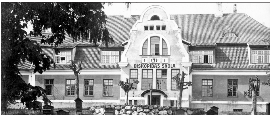
VECBEBRU BIŠKOPĪBAS SKOLA savā krāšņumā 20. gadsimta 20. gados.

Laika ritējumā daudzkārt mainījies skolas nosaukums, tās mācību programmas papildinātas ar jaunām specialitātēm, bet visos laikos kā zelta pavediens skolas darbam cauri vijās bišu gudrību apguve – biškopības apmācība Vecbebras bija no pirmās līdz