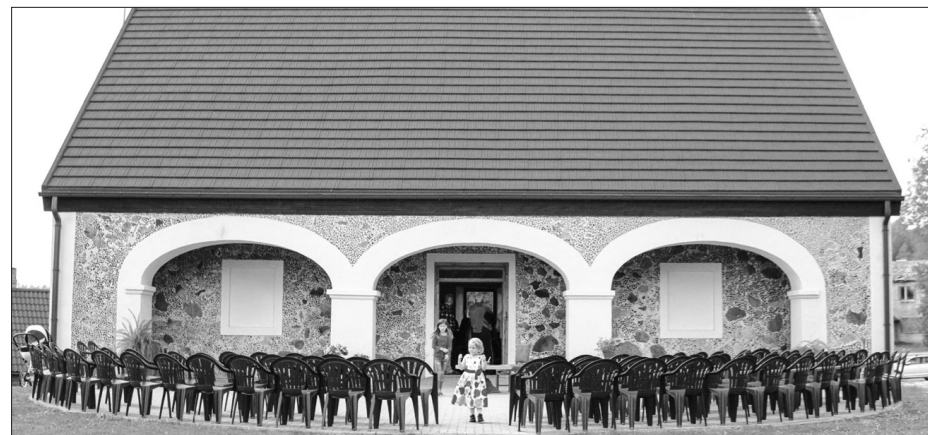
IRŠU MUIŽAS KLĒTS atjaunošana pabeigta šī gada aprīlī.

◆ “Mūzikas instrumentu iegāde Kokneses Mūzikas skolai” – iegādāta viena piccolo flauta, divi klavieru krēsli un nošu pulsts. Projekta kopējās