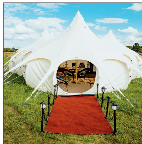
ČETRU TORNĪŠU TELTS, kas iegādāta ar Aizkraukles novada pašvaldības atbalstu.