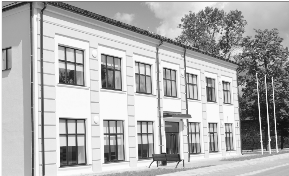
PĀRBŪVE. Kādreizēja veikala telpās Raiņa ielā 45 tagad darbosies Pļaviņu bibliotēka un bērnu bibliotēka.

◆ Izveidots dienas aprūpes centrs, renovētas divas telpas, ierīkots lifts un veiktas vairākas aktivitātes, kurās apmācīti sociālie darbinieki. Projekts tiek īstenots no 2019. gada 9. novembra līdz 2022. gada 8. septembrim. Kopējās projekta partnera izmaksas – 255 302,26 eiro, tajā skaitā ERAF finansējums – 229 772,03 eiro, valsts budžeta dotācija – 11 367,77 eiro, Aizkraukles novada pašvaldības līdzfinansējums – 14 162,46 eiro.