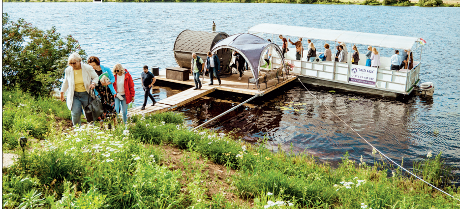
PIRTIŅA uz pontona, kas kalpo arī kā kuģīša piestātne.

sabiedrisku pasākumu, kas būtu pieejami visai sabiedrībai. “Tagad mēs varam atļauties sasaukt cilvēkus uz nodarbību brīvā dabā, jo mums ir jebkuriem laika apstākļiem piemērots patvērums. Tas ir unikāls veids, kā pietuvoties dabai,” saka Dace Elza Druva.