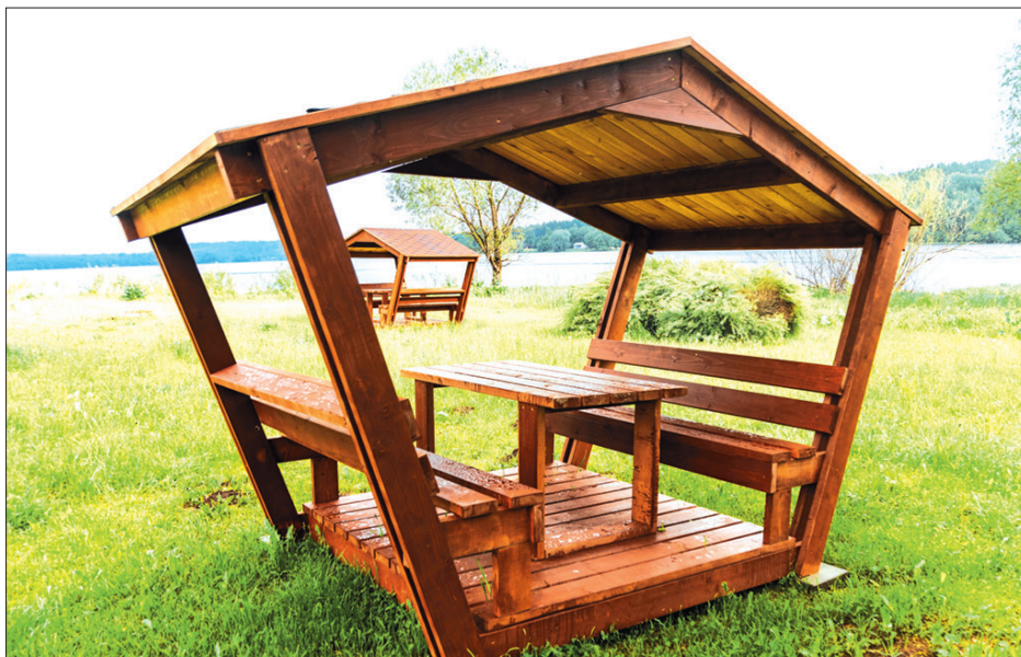
IZCILA VIETA. Secē un Staburagā pie Daugavas nu ir jaunas nojumnes, kurās ikviens var baudīt atpūtas brīžus.

◆ Projektā “Ceļu virsmas apstrāde Jaunjelgavas apvienības pārvaldes teritorijā” 2022. gadā trīs ceļu posmiem – Mazās Daugavas ielas no Rī-