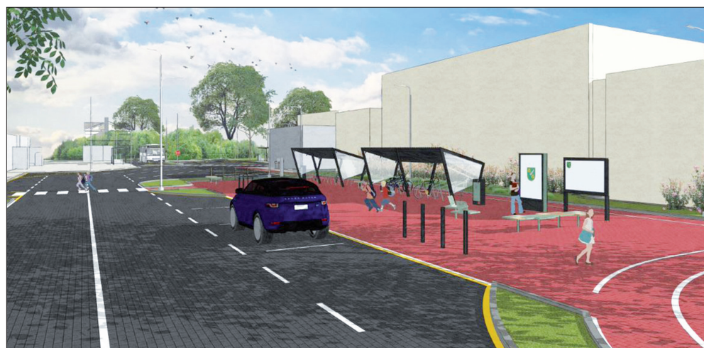
SKICE Stacijas laukuma pārbūvei Skrīveros, ko izstrādājusi SIA "brook interior architecture".

līdzfinansējumu paredzēts īstenot projektu "Dabas takas atjaunošana Daugavas ielejas dabas parkā" – tiks ierīkoti divi koka informācijas stendi un labiekārtota taka. Projekta kopējās izmaksas ir 1 700 eiro, tajā skaitā biedrības "Daugavas Savienība" finansējums – 700 eiro, pašvaldības finansējums – 1 000 eiro.