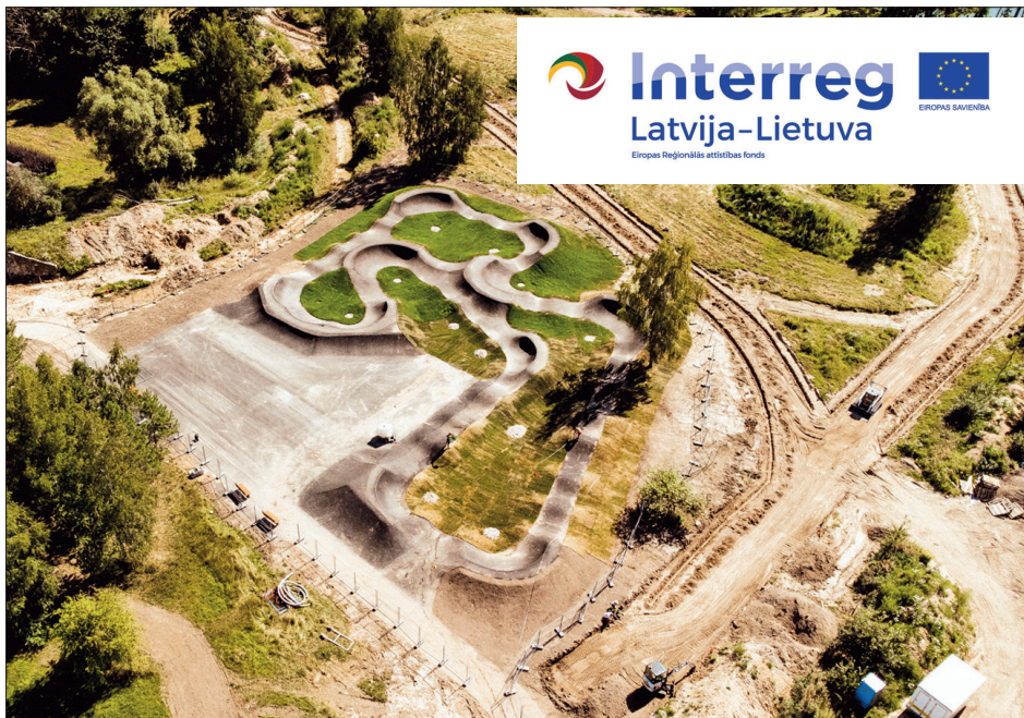
VELOPARKS vizuāli veidots kā Daugavas ūdenskrātuves ģeomorfoloģiskais modelis.

Jaunā veloparka kopējā platība ir 9203 kvadrātmetri. Tajā ir asfaltēta velotrase jeb pampatreks, gājēju takas un