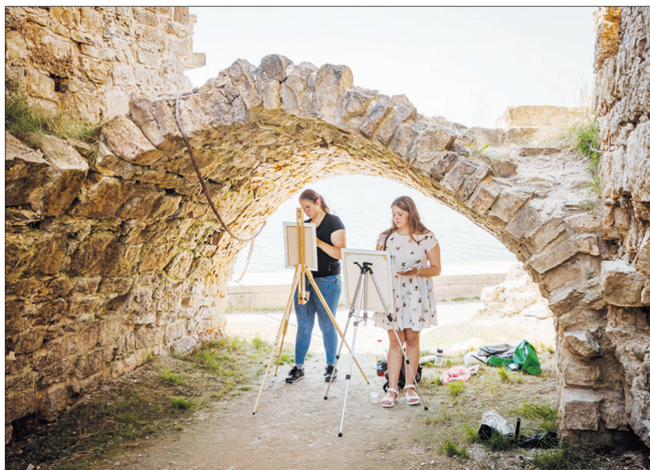
KOKNESĒS TEIKSMAINĀ SENATNE jauno mākslinieču redzējumā.

Plenērā piedalījās Latvijas un Lietuvas jaunieši, kuriem jau ir saistība ar darbošanos mākslas jomā. Dalībnieku vidū bija jaunieši, kuri studē Latvijas Mākslas akadēmijā, Kauņas Mākslas