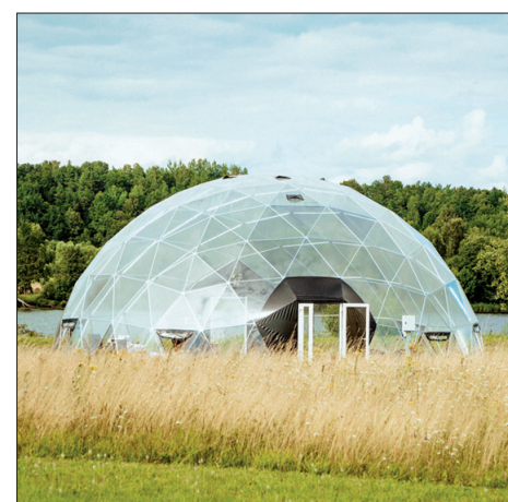
SFĒRISKAIS KUPOLS ir neparasts un jauks patvērums.