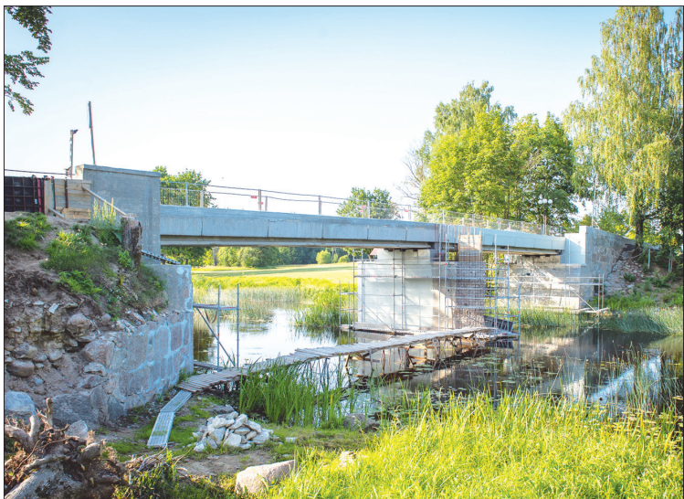
MARIJAS TILTS Ērbergē iegūst jaunu veidolu.

◆ "Ielu segumu atjaunošana Neretas novadā", kas ietver objektus ar kopgarumu 7,172 km: Neretas pagastā – Dārza, Kalēju, Draudzības, Nākotnes, Saules, Kalna, Ziedu, Klusās, Jāņu, Zaļās, Liepu, Parka, Pasta ielas (4,303 km); Mazzalves pagastā – Ziedoņu, Zaļās, Susējas ielas (2,62 km); Pilskalnes pagastā – Draudzības iela (0,174 km); Zalves pagastā – Senči–Pūpoli ceļš (0,075 km). Ielu segumu atjaunošanas darbi tika pabeigti 2022. gada jūlijā, uzlabojot ielu un ceļu kvalitāti. Būvdarbu summa – 567 221,03 eiro, finansējums – Valsts kases aizdevums Covid-19 izraisītās krīzes seku mazināšanai un novēršanai.