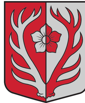
IRŠU PAGASTA ĢERBONIS

Zaļā laukā attēlota zelta gailene, vairoga augšējā daļā vairogs dalīts ar skuju griezumam – tas saucas ar pagasta logo, kur līdzās dzelzceļa slieķēm redzami koki un mežs. Tā ir pirmā reize, kad Latvijas heraldikā parādīsies sēne. Parastā gailene sastopama gan jauktos, gan arī lapu koku mežos no jūnija līdz oktobrim. Gailene ir radījusi iedvesmu māksliniekiem, filozofiem un dzejniekiem gadsimtiem ilgi – senās Ķīnas dzejoļu antoloģijās tā minēta kā dzīvības un veiksmes simbols. Savkārt daudzās Āzijas valstīs gadumijā gailenes tiek ēstas, lai piesaistītu laimi un panākumus nākamajā gadā. Gailenes ir ārstniecisko sēņu piramīdas augšgalā.