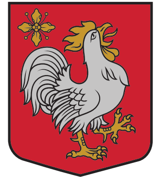
MAZZALVES PAGASTA ĢERBONIS

Uz sarkanā pelēka vairoga redzami grezni staltbrīža ragi, kas simbolizē pagasta nosaukuma etimoloģiju. Pagasta nosaukums cēlies no vācu vārda "Hirsch" (briedis, Iršu muiža – Hirschenhof). Iršos no 1766. līdz 1939. gadam atradās liela vācu zemnieku kolonija. Sarkanā un sudraba krāsa norāda uz pagasta piederību Vidzemei (atsauce uz Vidzemes vēsturiskās zemes ģerboņa krāsām). Vairoga centrā attēlots pieclapu zieds, kas ar ragiem veido vienotu figurālo kompozīciju. Ragī arī simbolizē pagasta bagāto pagātni, bet zieds – pagastu mūsdienās, kas ir plaukstošs un ziedošs.