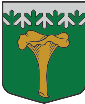
DAUDZESES PAGASTA ĢERBONIS