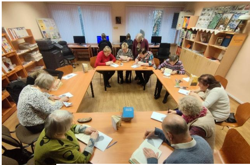
Orimoto - grāmatu locīšanas nodarbība. 20.12.2025.