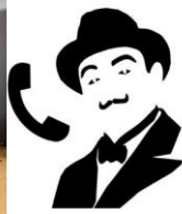
Sarunas par grāmatām un lasīšanu.

12.februārī, trešdiena, plkst.15:00 Kokneses bibliotēkā.