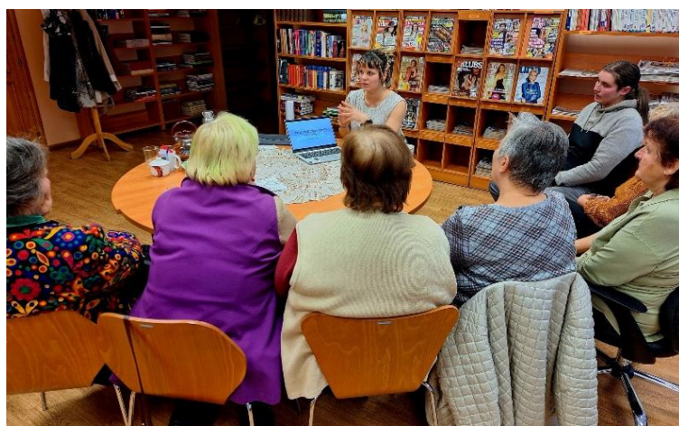
Lekcija un diskusijas par tēmu "Dzīvesveida ietekme uz klimatu". 23.10.2025.