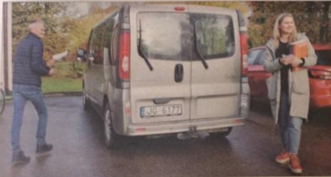
VAR DOTIES ĒSĀ.