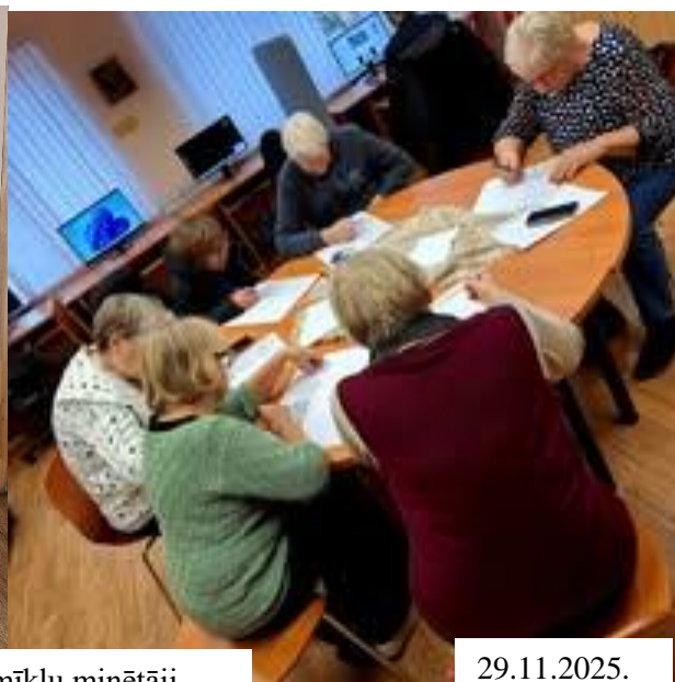
Krustvārdu mīklu minētāji.