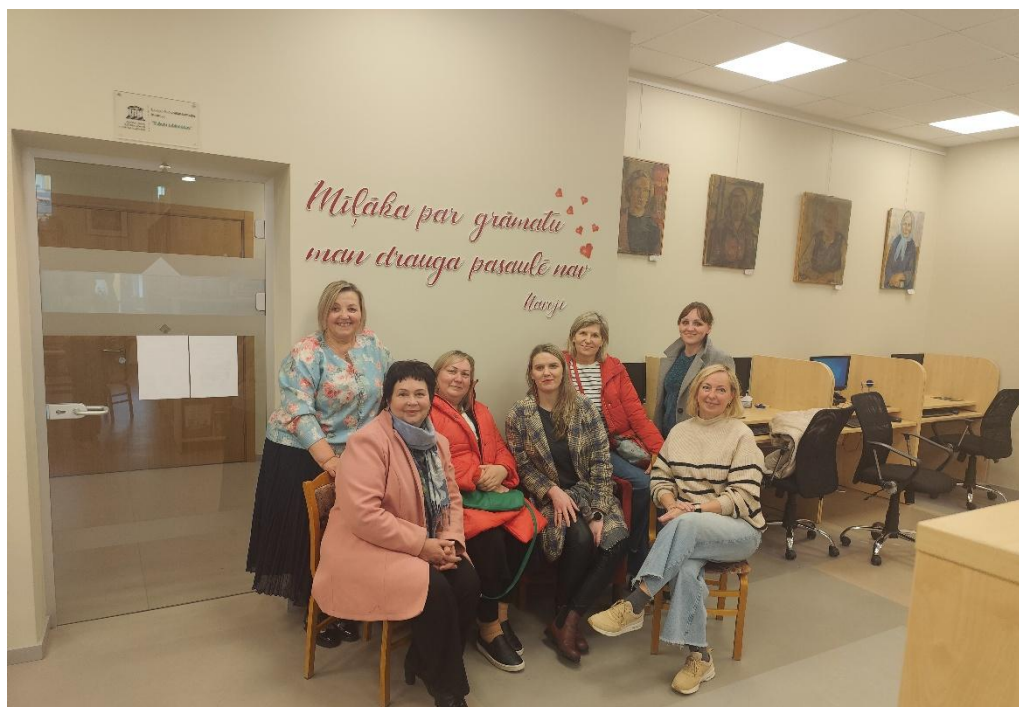
Pieredzes apmaiņas brauciens uz Bauskas novadu – Foto uzņemts Pilsrundāles bibliotēkā. 22.10.2025.