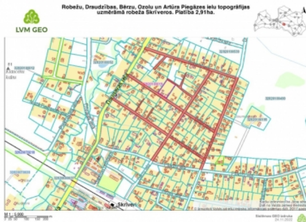
Attēls Nr.1 – izpētes teritorija