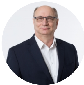
Leons Līdums Domes priekšsēdētājs